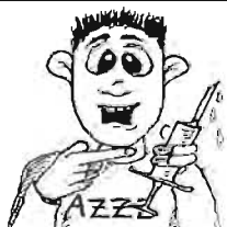
Bisher hat noch keiner den Impfstoff gegen die Schweinegrippe getestet