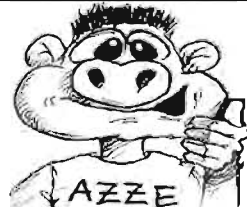
...Hurra...es hat funktioniert!!